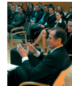
Prof. Dr. Bert Rürup, TU Darmstadt, beim Kaminabend mit Studentinnen und Studenten der Bayerischen EliteAkademie

Wesentlicher Bestandteil unseres Curriculums sind die interdisziplinären Projektarbeiten. Im fachübergreifenden Dialog, begleitet von Tutoren aus Wissenschaft und Praxis, arbeiten unsere Studententeams an Projekten mit aktuellem Bezug. Oft entstehen die Projektarbeiten in enger Kooperation mit der Wirtschaft und den Förderfirmen der Akademie. Bereits realisierte Projektarbeiten beschäftigten sich mit den Themen Biotechnologie und Gentechnik, Wasser als Ressource, innovativen Unternehmensgründungen sowie Energieversorgung und Mobilitätsforschung.